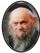
החטא קובע את מהות האדם

"כאשר הוא שם", דנים את האדם לפי מעשיו ברגע זה. ואם מישוה יבא ויבא עליו נבואות שחורות, יהיה קשה לסבול את זה, ומתייחסים לדבריו כאל גומואות בעלמא. וכאן התורה מציעה לנו כוז דוגמא, עם כאלו חשדות! איך יתכן? אם אנו נאמר לאיזה תלמיד שאם יעזוב את הישיבה הוא עלול לרדת עד שפל המדרגה, כאשר הוא עכשיו במצב רוחני גבוה, הדברים לא יתקבלו.